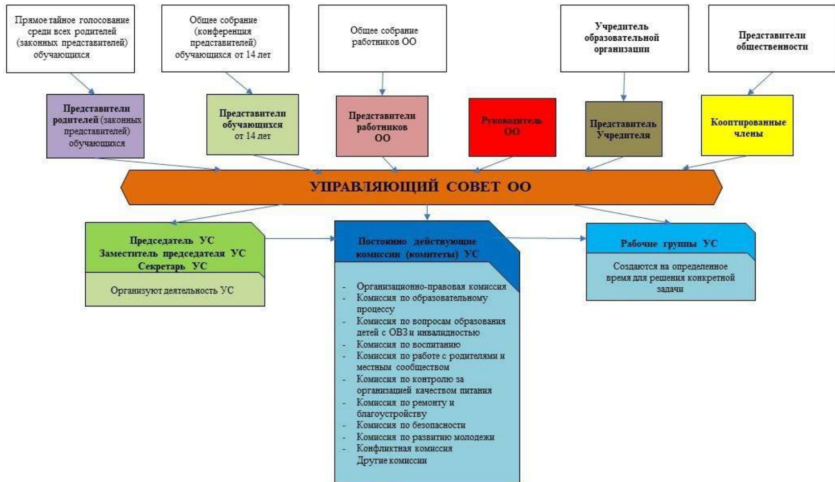
Рис. 1. Модель № 1 – «Управляющий совет общеобразовательной организации» (УС ОО)