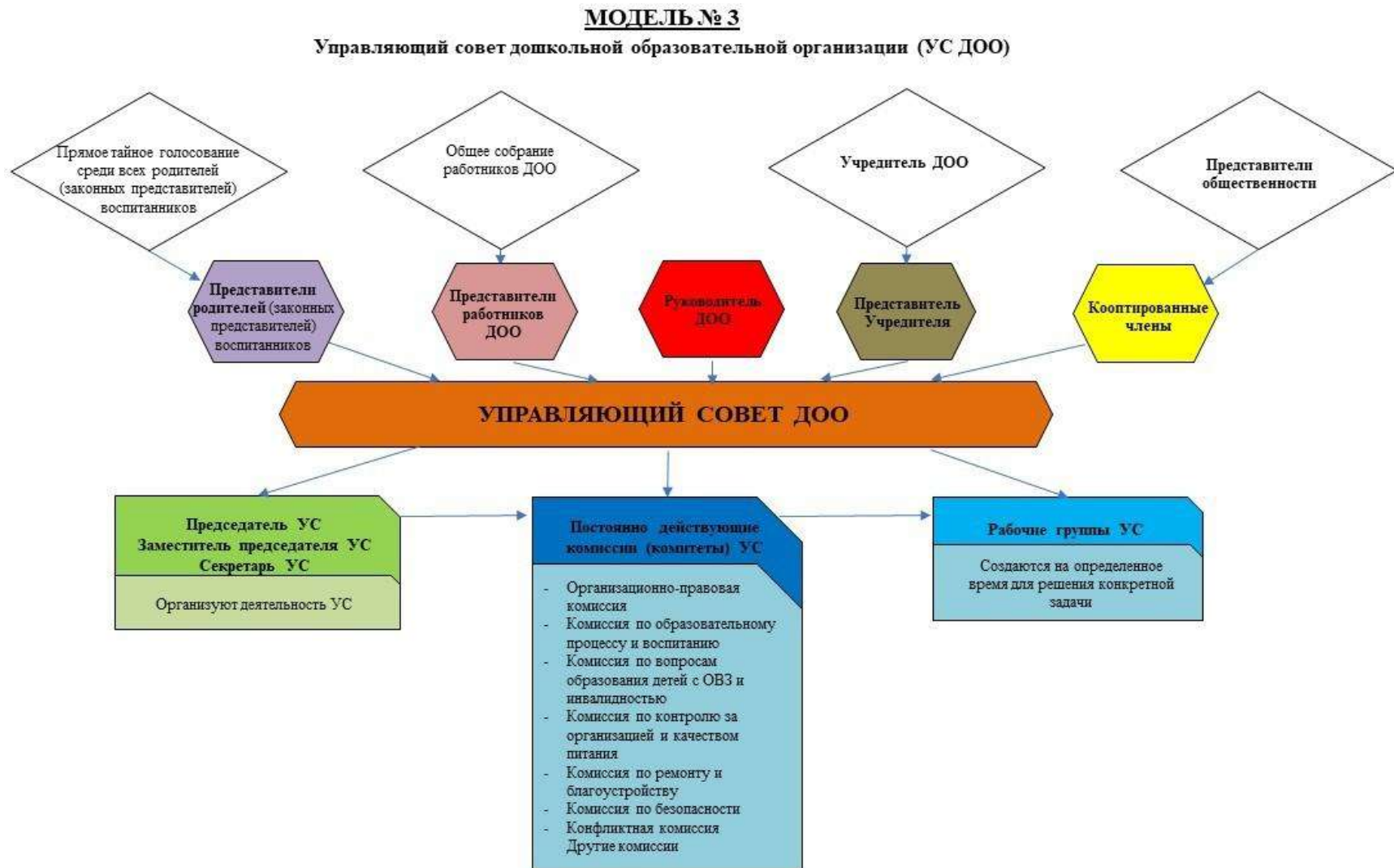
Рис. 3. Модель № 3 – «Управляющий совет дошкольной образовательной организации» (УС ДОО)