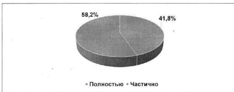
Рис. 3. Обеспеченность ДОО города Тулы учебно-методическими и игровыми материалами (в %).

По данным мониторинга 100% образовательных учреждений города Тулы, реализующих дошкольное образование, обеспечены учебно-методическими и игровыми материалами, однако только 39 образовательных учреждений (58,2%) обеспечены полностью, а 28 образовательных учреждений (41,8%) – частично (рис. 3):