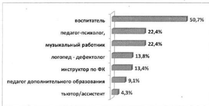
Рис. 2. Наличие вакансий педагогических работников в ОО города Тулы (в %).

По результатам мониторинга полностью укомплектованы педагогическими кадрами 36 (53,7% от общего числа) дошкольных образовательных организаций, частично – 31 (46,3%). Наличие вакансий воспитателя указали 34 образовательных учреждений (50,7%), наличие вакансии узких специалистов (музыкальный работник, педагог-психолог, инструктор по физкультуре, логопед, педагог дополнительного образования) подтвердили руководители 25 образовательных учреждений (37,3%) (рис.2).