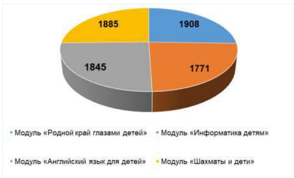
Рис. 2. Количество воспитанников, принимающих участие в реализации модулей Программы

Участие детей в реализации модулей Программы в 2022-2023 уч. году представлено на (рис. 2).