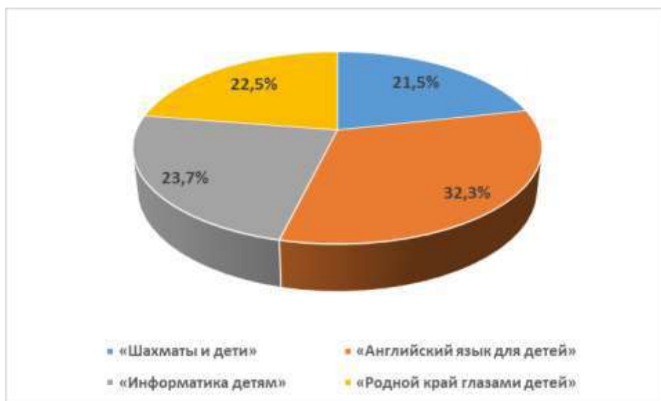
Рис. 4. Рейтинг модулей Программы, вызывающий наибольший интерес у воспитанников и их родителей

Рейтинг модулей программы, вызывающий наибольший интерес у воспитанников и их родителей представлен на рис.4.