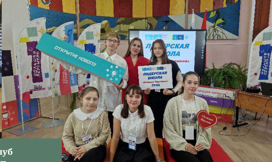
Клуб «Большой Перемены»