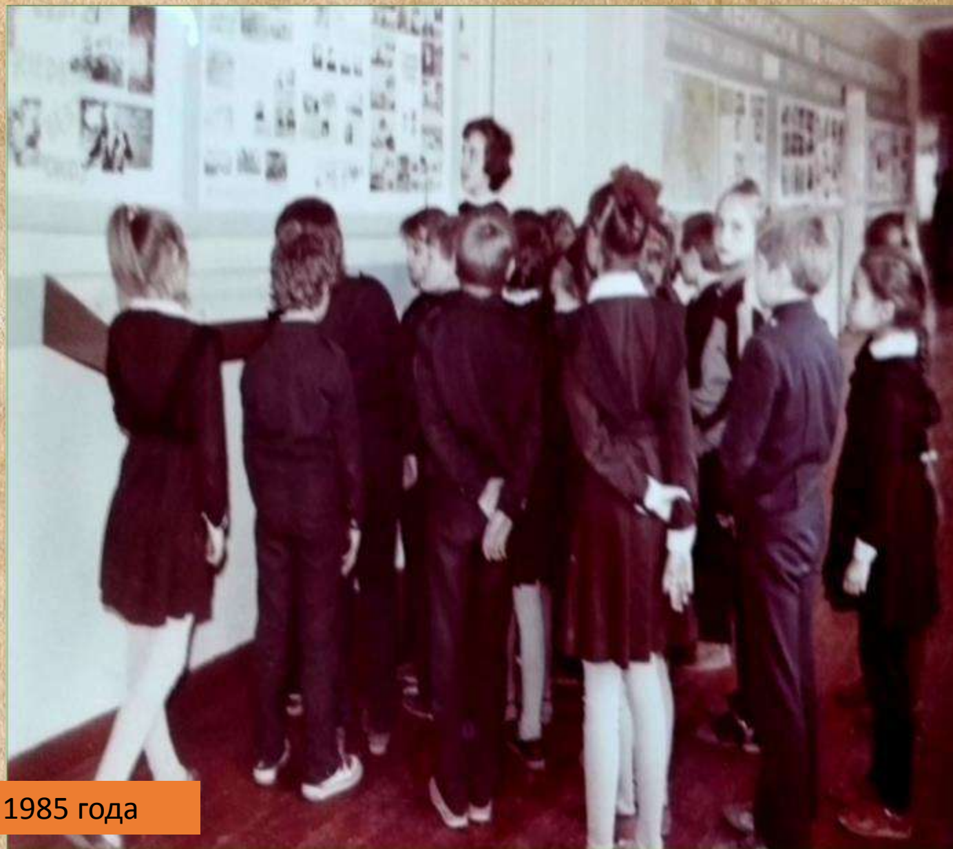
Фото 1985 года

18 мая 1999 года – официальное открытие Музея боевой и трудовой славы