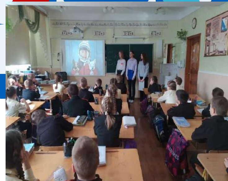
Функционирует Совет старшеклассников