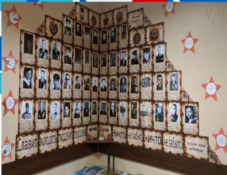
Музейная экспозиция, посвященная летчикам авиаторам