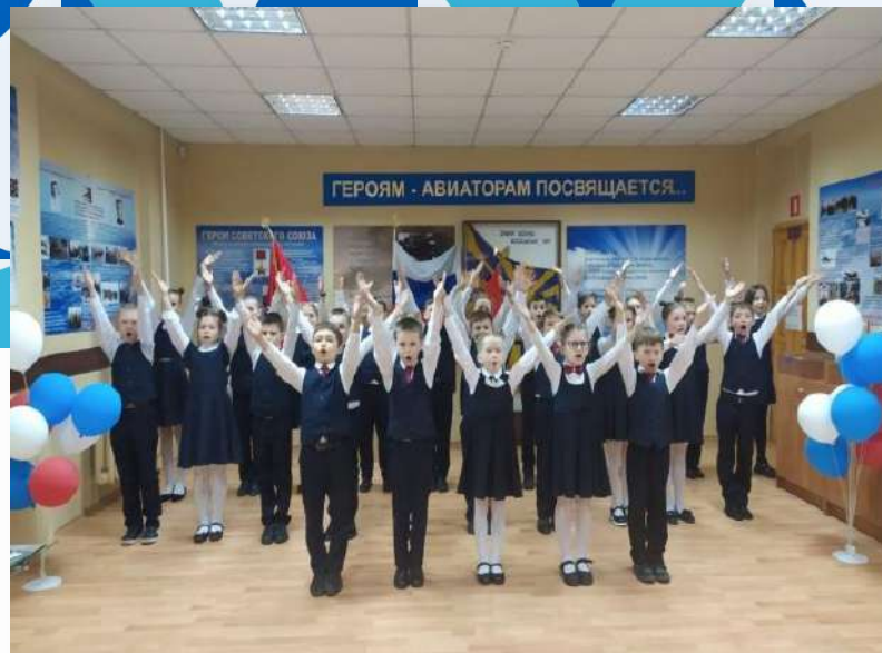
Участие в конкурсе «Верность отцам – верность Отчизне»