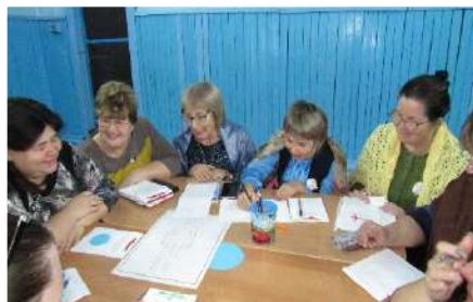
Педагогический форум «Развитие образования Зиминского района»