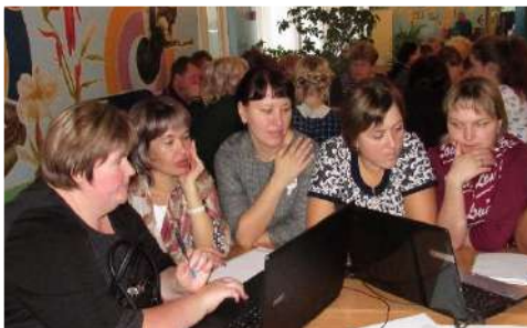
ЕМД семинары - практикумы