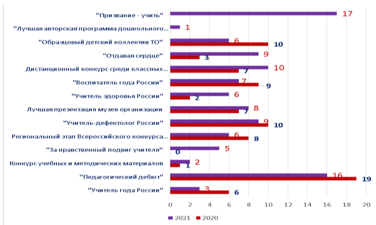
Диаграмма 1. Количество участников конкурсов профессионального мастерства с наибольшим количеством участников

Динамика участия педагогов в региональных этапах всероссийских конкурсов 2021 года представлено на диаграмме ниже: